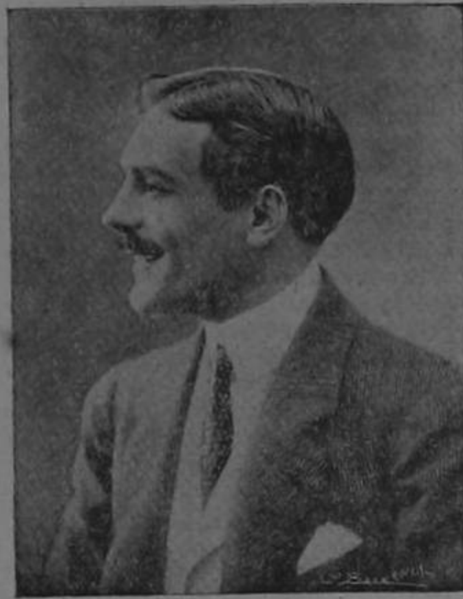
MAX LINDER Protagonista de la obra «Petit Café»

La continua lucha por la vida que durante el día nos tiene altamente preocupados, requiere que en la noche gocemos un rato de agradable esparci-